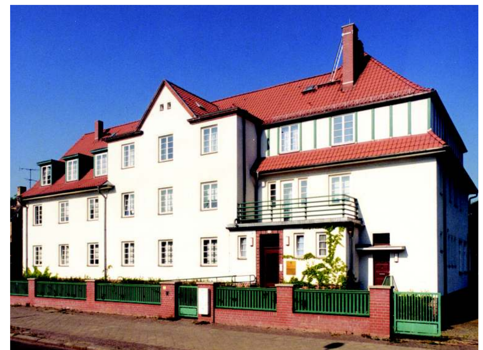
Seit 1994 hat die Zentrale wieder in Leipzig, in der Pistorisstraße 6, ihren Sitz.

Das GAW gewinnt Frauen und Männer zur Mitarbeit. Es ist ein verlässlicher Partner und verwendet anvertraute Mittel transparent.