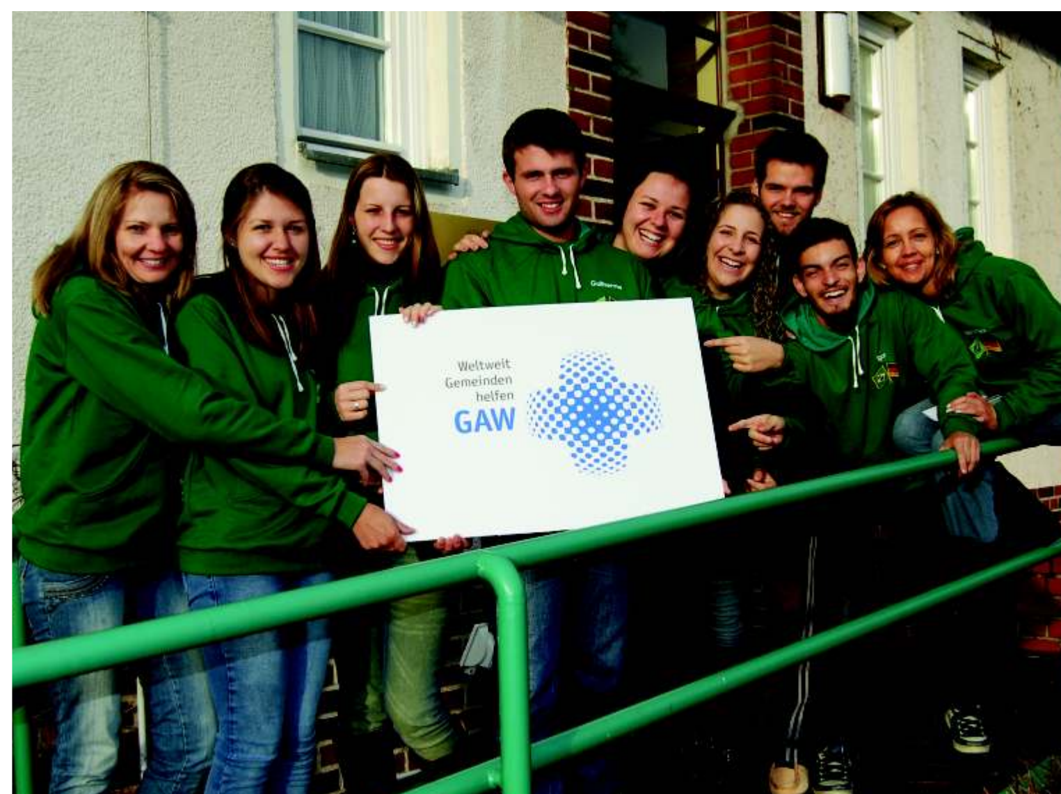
Brasilianische DeutschlehrerstudentInnen erhalten Unterricht in Deutschland und tragen das erworbene Wissen in ihre Gemeinden

Das GAW weckt und pflegt in Gemeinden, Landeskirchen und der EKD das Bewusstsein für evangelische Diaspora. Es stärkt die evangelische Stimme in der Ökumene.