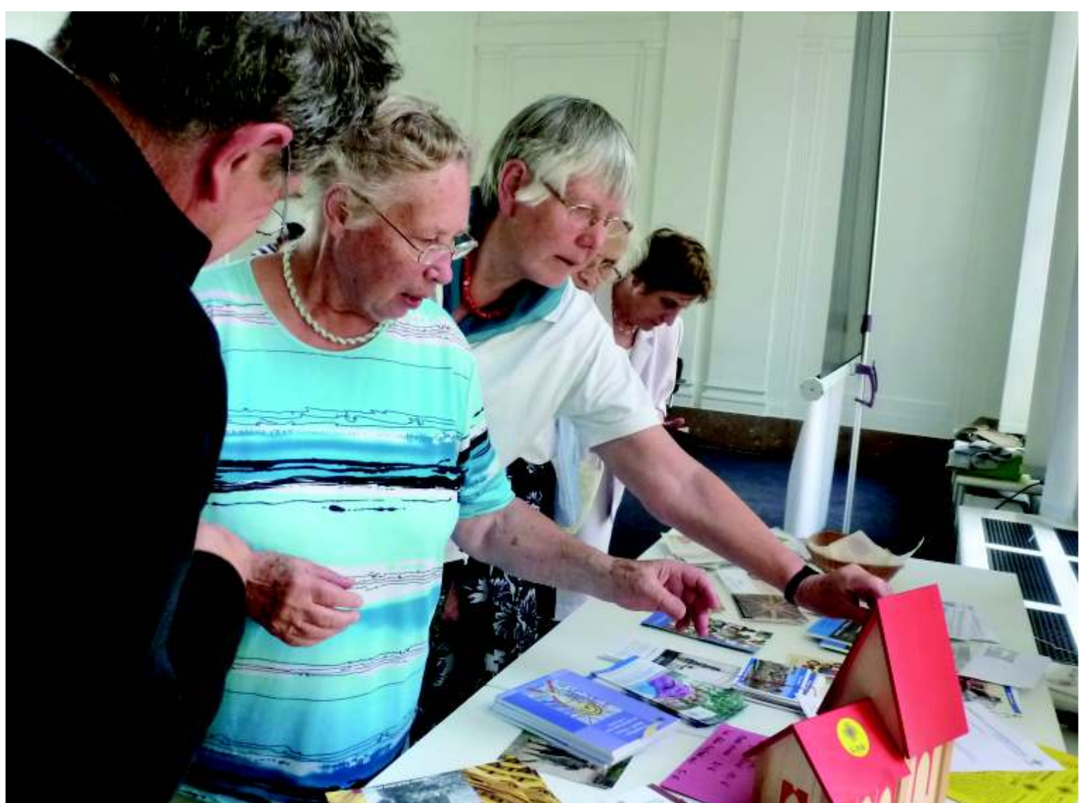
Informationsveranstaltung des GAW Berlin-Brandenburg-schlesische Oberlausitz

Das GAW weckt und pflegt in Gemeinden, Landeskirchen und der EKD das Bewusstsein für evangelische Diaspora. Es stärkt die evangelische Stimme in der Ökumene.