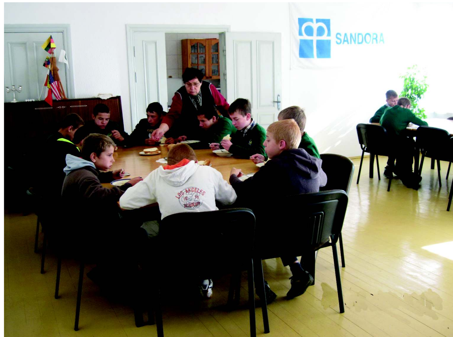
Betreuung von vernachlässigten Kindern durch die litauische Diakonie

Das GAW hilft weltweit evangelischen Gemeinden, ihren Glauben an Jesus Christus in Freiheit zu leben und diakonisch in ihrem Umfeld zu wirken.